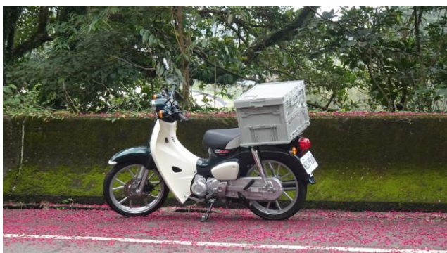
▲ 不老騎士剛考上駕照的假文青之旅