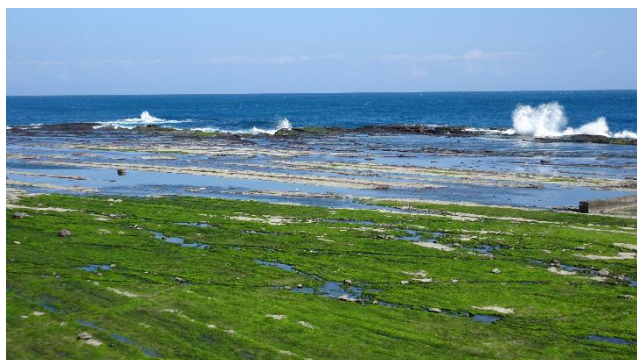
▲ 東北角海岸馬崗的古老地質與綠藻