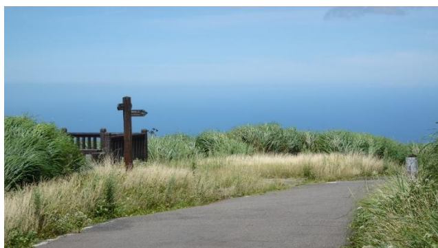
▲ 大屯山頂朝北海望出一片青綠斑駁