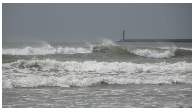
▲ 海線風情的臺灣海峽巨浪大觀