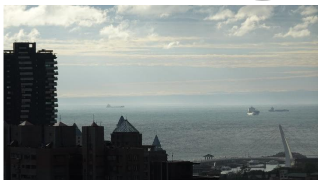
▲ 每天早上醒來就是看海的日子